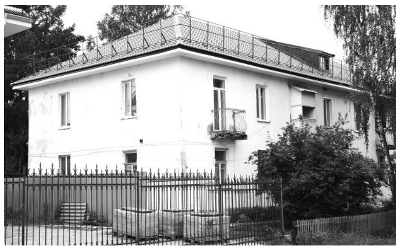
Дом по ул.Ленина, 24 в п.Думиничи.

Нина Борисова, пресс-секретарь Фонда капитального ремонта многоквартирных домов Калужской области.