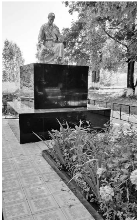
Памятник в Гульцове.

В будущем году запланирован ремонт еще четырех воинских захоронений.