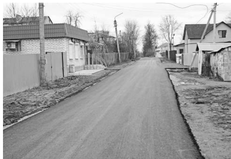
Подъезд к детскому саду «Ягодка» со стороны пер. 1-й Ленинский.

Первый – замена асфальтобетонного покрытия на ул. Пионерская. Протяжённость участка – 762 м, а всего – около километра, включая 15 съездов, из которых два большие – на улицы Первомайская и Б.Пролетарская, там дорога состыкована с дворовыми территориями многоквартирных домов.